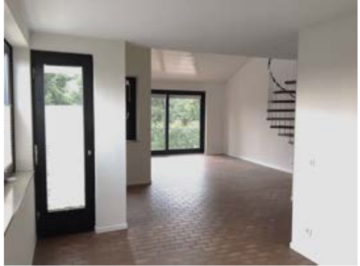
Wohnzimmer (vor Einzug)