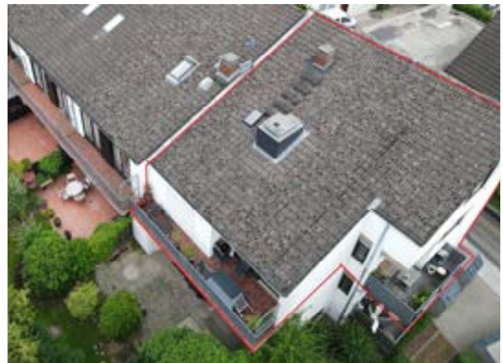
Lage der Wohnung