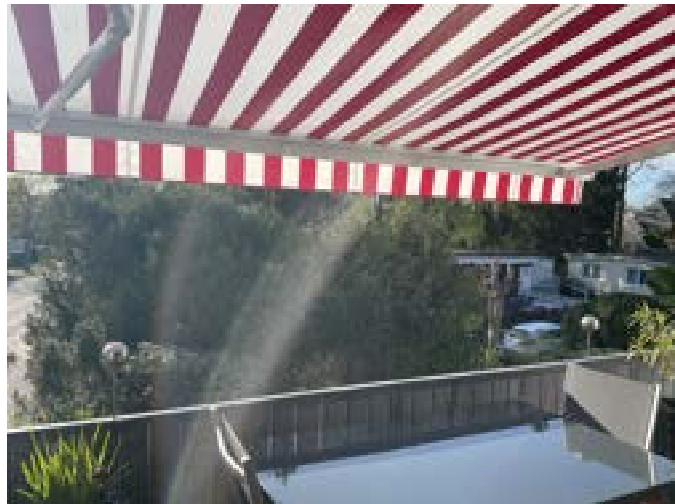
West Balkon mit elektrischer Markise und elektrisch runterfahrbarem Volant.